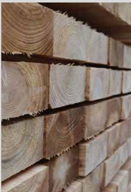
Byggemarkeder og håndværkere melder om stigende efterspørgsel efter certificeret træ.

Mester Tidende har også udført en rundringning til flere håndværksmestre og konklusionen er, at man stort set kun bru-