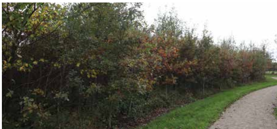
Ny aftale sikrer op til 200 hektar bynær skov til København. Arkivfoto.

Ekspropriation af skov i forbindelse med elektrificering af jernbanenettet risikerer at ramme skovejere hårdt. Læs mere side 14.