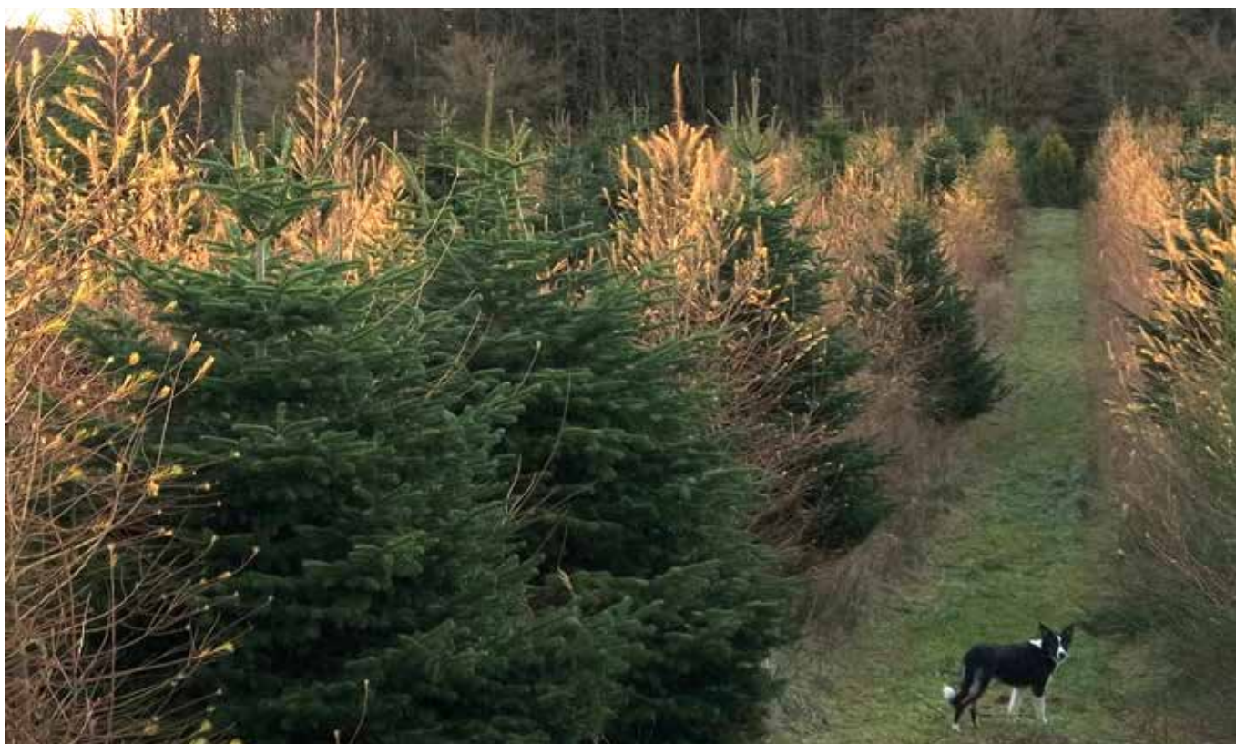
Nordmannsgran underplantet med hybridlærk

Ved juletræsstubben plantes en lærk, gerne europæisk eller japansk lærk af bedste afstamning. Det giver det bedste tømmer. Vælges hybridlærk opnås den hurtigste kulturstart.