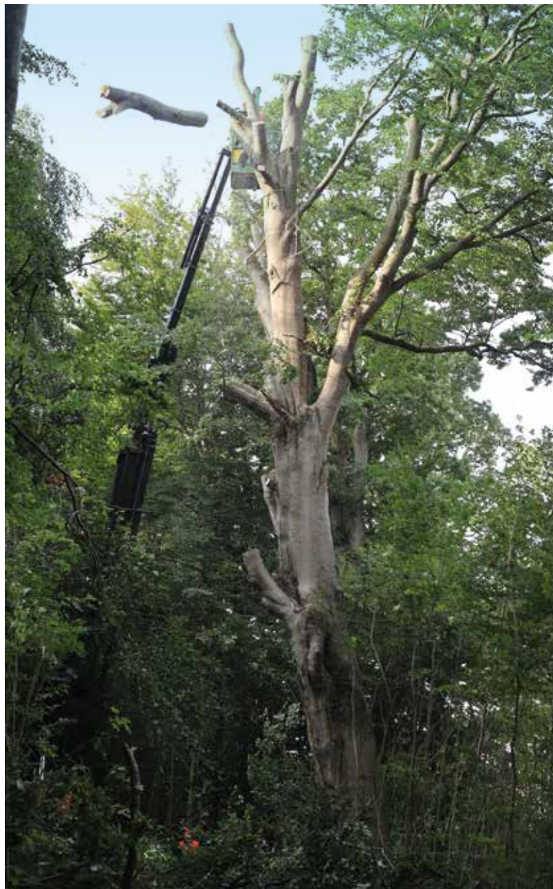
Fra 15-20 meters højde kappes bøgetoppen ned. Claus Fuglsig Jensen arbejder med motorsav i liften. På billedet er endnu en stor gren på vej imod jorden.

Kun toppene skæres ned. De metertykke bøgestammer bliver stående tilbage. ➔