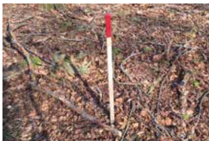
Ekspropriation af skov kan risikere at blive dyrt for ejeren.