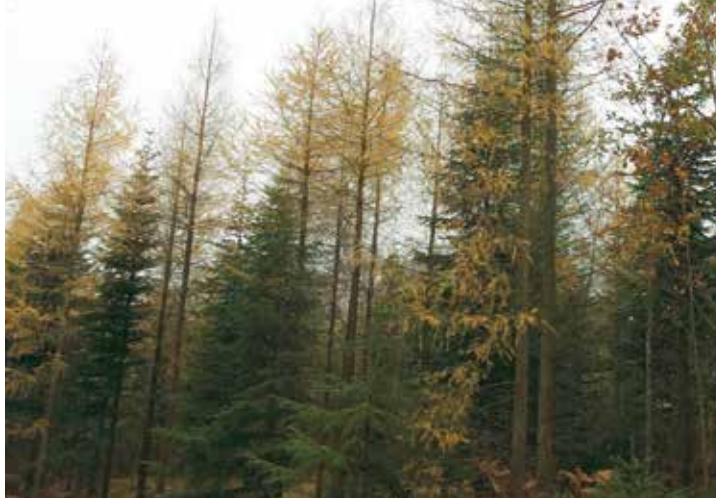
Lærk indplantet i gammel kultur

Hvis der er fældet mange juletræer, skal der ikke plantes ved hver stub. 2000 jævnt fordelte hybridlærk pr. hektar er nok.