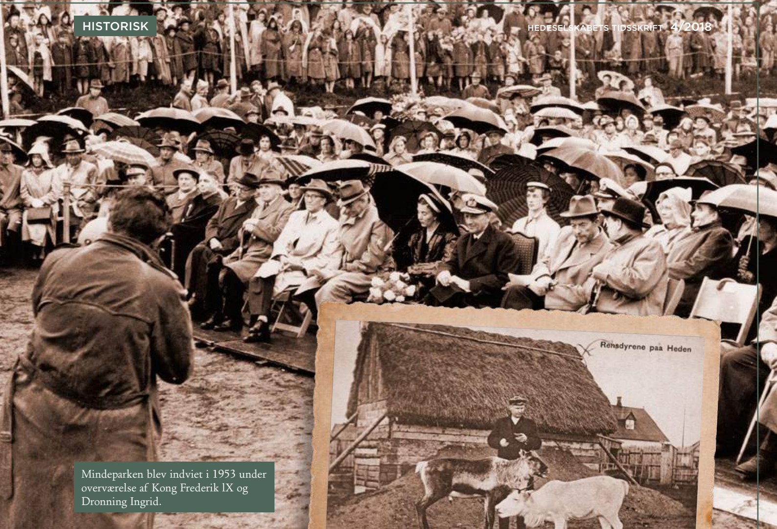
Mindeparken blev indviet i 1953 under overværelse af Kong Frederik IX og Dronning Ingrid.