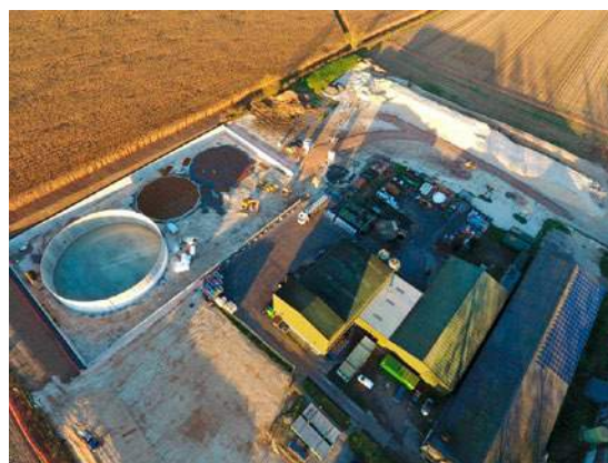
Nyt biogasanlæg i Storbritannien skal omdanne 75.000 tons madaffald til gas.

Orbicon skal udføre geologiske undersøgelser og miljøundersøgelser, en detaljeret risikovurdering, og en plan for jordhåndtering. En risiko af en forurening vurderes ved at se på koncentrationen af forureningen, spredningsveje og om hvorvidt det kan medføre en miljø- eller sundhedsmæssig fare i omgivelserne. På baggrund af risikovurderingen, lægges en plan for jordhåndteringen, hvor der kan være forskellige alternativer for behandling af jorden ud fra miljømæssige, tekniske og økonomiske aspekter.