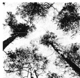
Et kikk opad

Trykt af Fr. G. Knudtzons Bogtrykkeri A/S Toldbodgade 57 1253 København K.