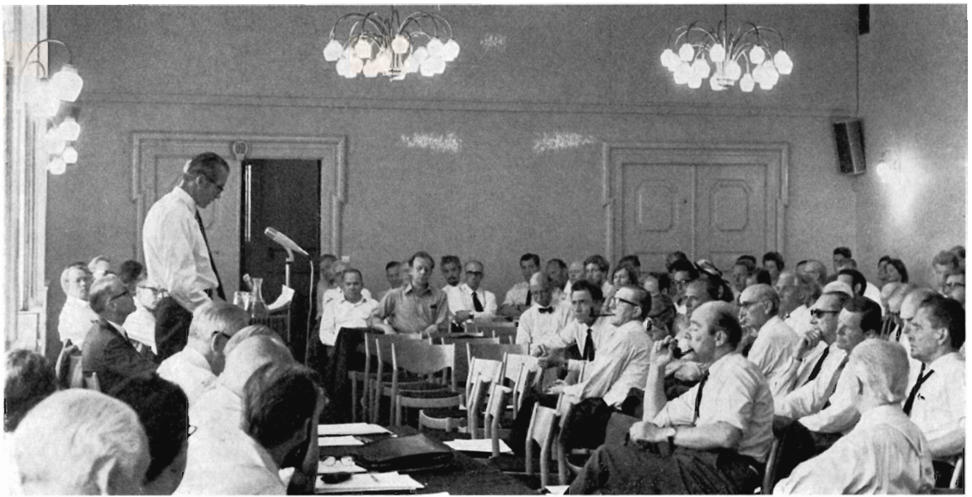
Det blev en generalforsamling i skjorteærmer, for varmen var enorm. Her aflægger formanden beretning og gør undskyldning for temperaturen, som bestyrelsen dog ikke har indflydelse på.