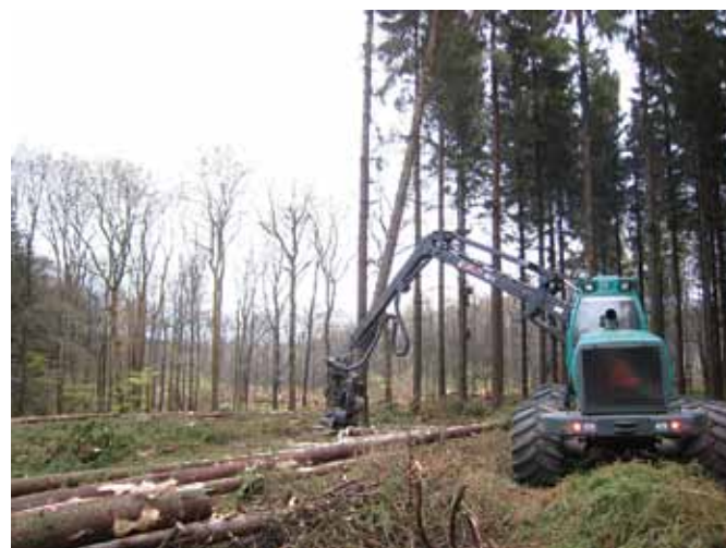
Der er skovet mange kubikmeter siden sommerferien.

Henrik Buhl Skovdyrkerforeningen Østjylland