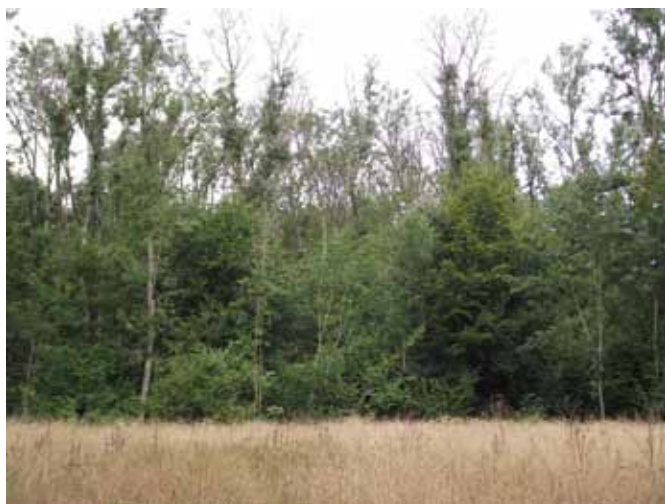
Askebevoksning med mange toptørre træer.

Heldigvis er især afsætningen for asketræ fin og priserne er endda steget noget gennem efteråret. Ask handles i stigende grad som standardvare uden klassificering af de enkelte stammer. Alle kvaliteter handles således som én sortering dog med en prisgraduering efter diameteren. Når kvaliteten af partiet passer til prisen, så er denne handelsform fornuftig. Gode kævler over 45 cm midtmålt, uden væsentlig brunkerne, klassificeres normalt enkeltvis.