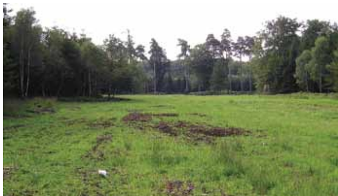
Nyetableret skoveng (vildtager) efter skovning, grenknusning og grundgødsning.

De lysåbne arealer er af meget stor værdi for vildtet i skoven. Her findes et stort fødeudbud i form af urter og græsser og en større forekomst af insekter til gavn for især småfugle og fasaner. Udover det større udbud af føde, skabes der lys og varme, som er to af vildtets grundkrav til skoven som levested.