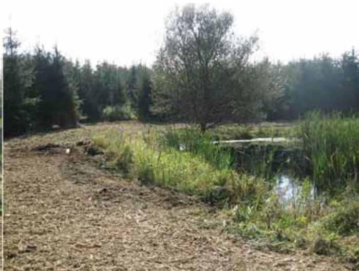
Her ryddes dele af nåletræsbevoksning for at finde skovsøen frem... En time efter er effekten til at få øje på!